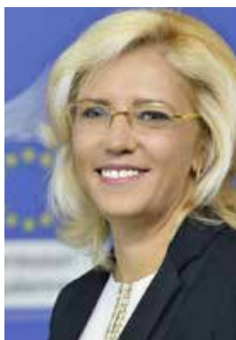
Corina Crețu Comisaria Política Regional Comisión Europea