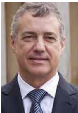
Iñigo Urkullu Lehendakari Gobierno Vasco País Vasco